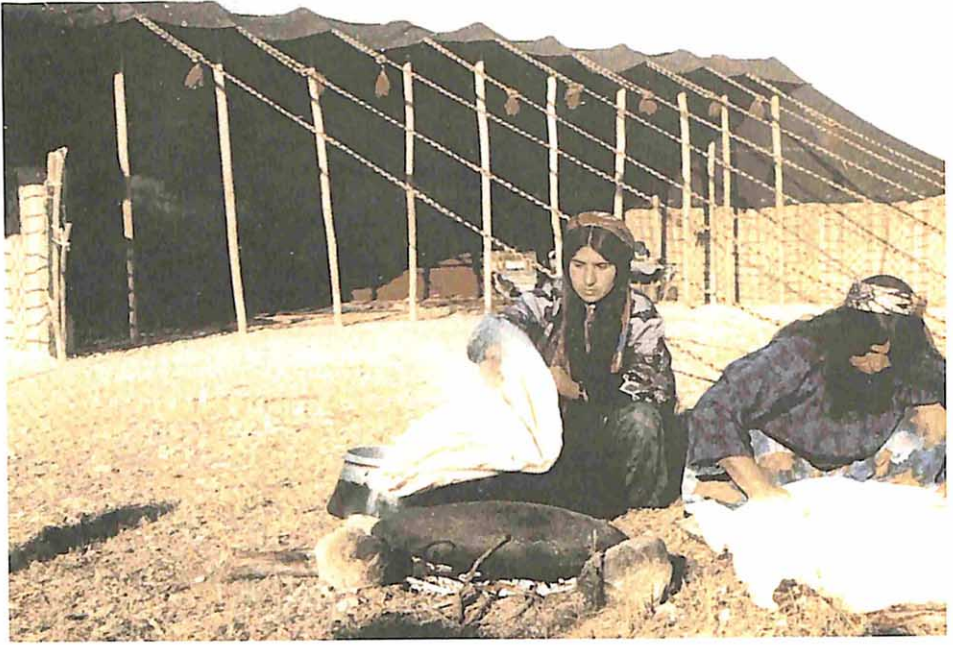
Türk-i çöreğin (lavaş) hazırlanışı